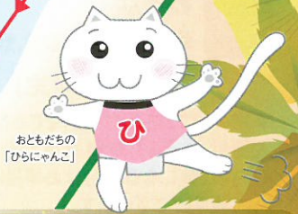
おともだちの「ひらにゃんこ」