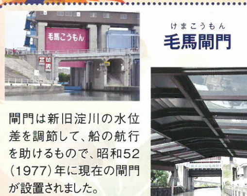
けまこうもん 毛馬閘門

閘門は新旧淀川の水位差を調節して、船の航行を助けるもので、昭和52(1977)年に現在の閘門が設置されました。