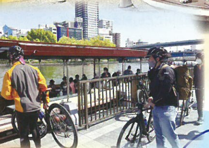
おほか東線 赤川鉄橋