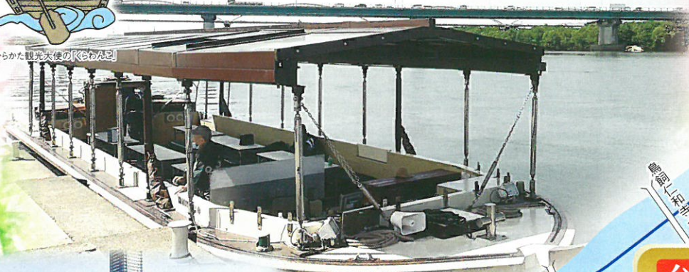
屋根船風遊覧船「えびす」