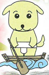
ひらかた観光大使の「くわんこ」