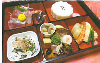
季節の御膳(イメージ)

月曜日の上りコース便限定で、 割烹藤の「季節の御膳」を鍵屋資料館の大広間でお召上がりいただける、 特別体験のオプションプランをご用意しました。 追加料金3,000円でお申し込みいただけます。 3日前までにお申し込みください。