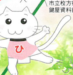
おとだちの「ひらにゃんこ」