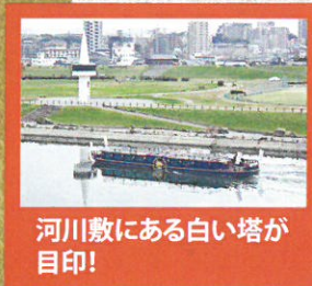
河川敷にある白い塔が目印!