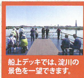
船上デッキでは、淀川の景色を一望できます。